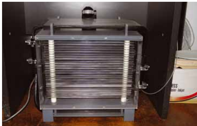
Fig. 6 - Exemplar da câmara de faíscas produzida nas oficinas do LIP para fins de divulgação e ensino.

O LIP desenvolveu competências em computação