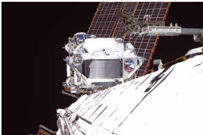
Fig. 4 - Instalação do detector AMS na Estação Espacial Internacional, em Maio deste ano. Na imagem vemos a transferência do detector do vaivém espacial para a Estação.

temas fundamentais. O LIP trabalha também desde 2004 com a Agência Espacial Europeia no estudo de ambientes de radiação no espaço, em contratos envolvendo também a indústria portuguesa.