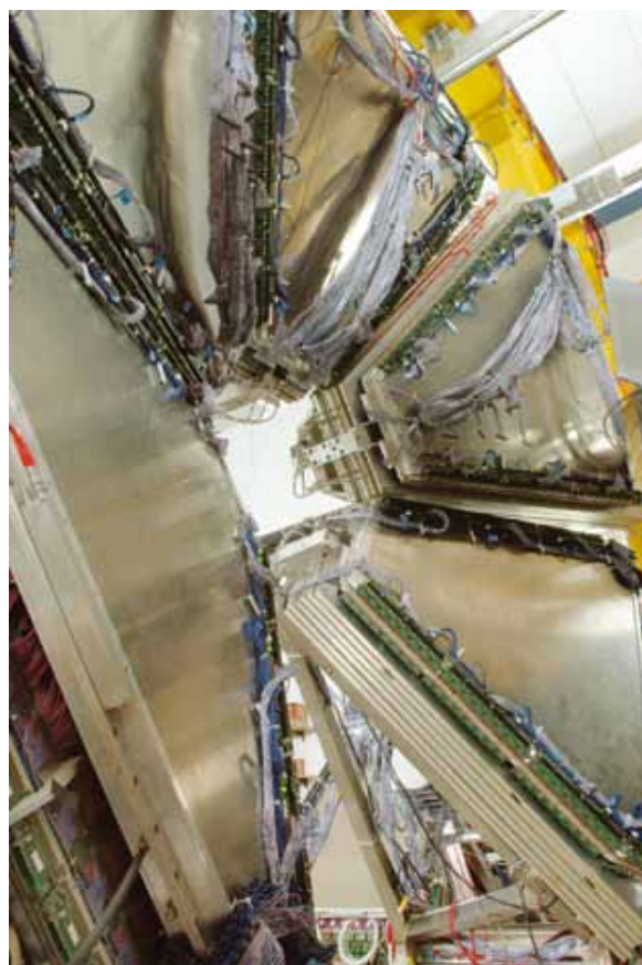
Figura 5 - O detector interno de tempo de voo de HADES é baseado em câmaras de placas resistivas (RPCs) e foi construído pelo LIP.

Por outro lado, é também longa a tradição do LIP na calorimetria, com numerosos projectos de investigação e desenvolvimento, em particular usando leitura por fibras ópticas. Como resultado directo, o LIP assumiu responsabilidades importantes na construção e teste do STIC, o calorímetro electromagnético de baixo ângulo de DELPHI no LEP, e, sobretudo, do TileCal, o calorímetro hadrónico de ATLAS no LHC. Para ambos os projectos, foram testados em Portugal muitos milhares de fibras ópticas e de telhas de cintilador.