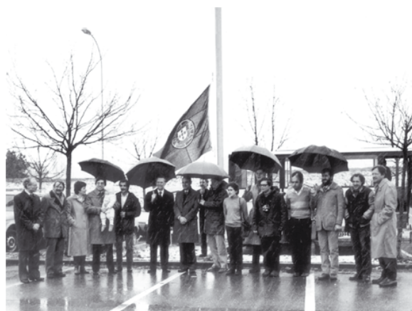
Fig. 1 - Cerimónia do hastear da bandeira portuguesa aquando da adesão de Portugal ao CERN, em que estiveram presentes vários dos membros fundadores do LIP.

Nestes 25 anos o LIP cresceu e transformou-se. Envolve hoje cerca de 170 investigadores, 70 dos quais doutorados, nas suas delegações de Lisboa, Coimbra e Minho. Em 2001, tornou-se Laboratório Associado do Ministério da Ciência, Tecnologia e Ensino Superior. Através do LIP, Portugal tem estado na primeira linha dos grandes projectos de física de partículas das últimas décadas. Os seus domínios de investigação englobam hoje a física experimental de partículas e astropartículas, o desenvolvimento de detectores e instrumentação associada, aplicações à física médica e computação avançada. As actividades do LIP desenvolvem-se em relação já não só com o CERN mas com diversas organizações de investigação nacionais e internacionais.